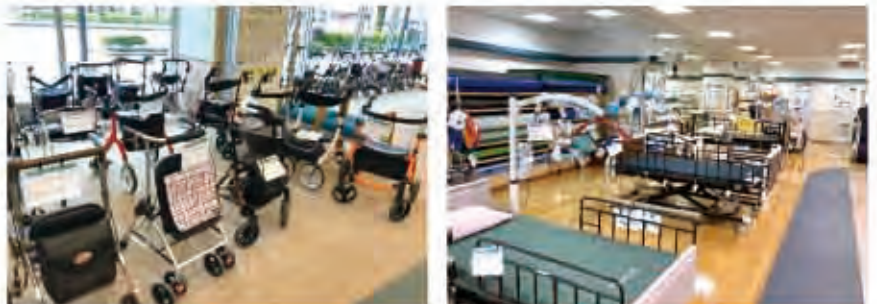
全沢健康福祉財団 プラザに併設している 福祉用具です

作業療法士歴14年目です。プラザに相談に来てよかったと思ってもらえるような、空間にしていきたいと思っています。