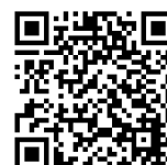
自立支援 教育訓練給付金